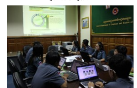
Programme e-Learning de l'OMD