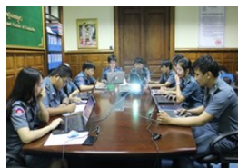
Programme e-Learning de l'OMD

Les coordinateurs ont mené à bien une enquête parmi les quelques 300 participants qui ont suivi le cours en ligne. Parmi eux, 160 certificats ont été décernés en une semaine et l'étude montre que pour 80 % d'entre eux, il s'agit d'un outil important de motivation. En outre, dans tout le pays, des fonctionnaires de la douane font état de l'importance et de la productivité de la plate-forme CLiKC!. Nous avons cependant rencontré certains problèmes techniques en raison de la lenteur du débit Internet. De plus, les capacités en anglais de certains fonctionnaires de la douane sont parfois insuffisantes pour comprendre la terminologie technique, ce qui pourrait être considéré comme un obstacle pour la mise en œuvre de la plate-forme CLiKC!.